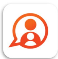
Konnnect OuderApp Konnnect B.V.

Welschap Kinderopvang werkt met een OuderApp en Ouderportaal van Konnect om individuele en/of groepsinformatie met u te delen: foto's, berichten en notities en nieuwsbrieven over de opvang van uw kind. U kunt op de berichten reageren, zelf berichten aan ons schrijven en een verzoek bij ons indienen.