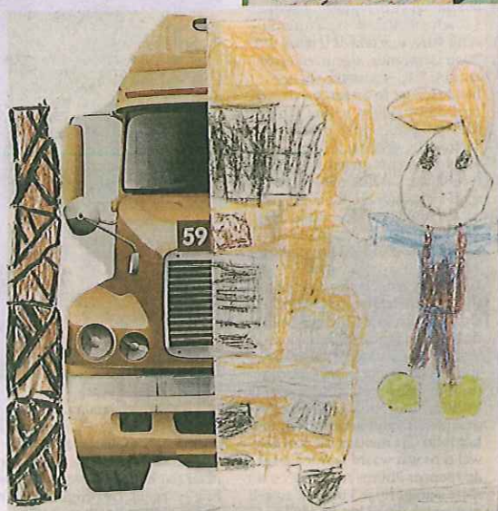
Annick tekende de andere kant van de vrachtwagen.