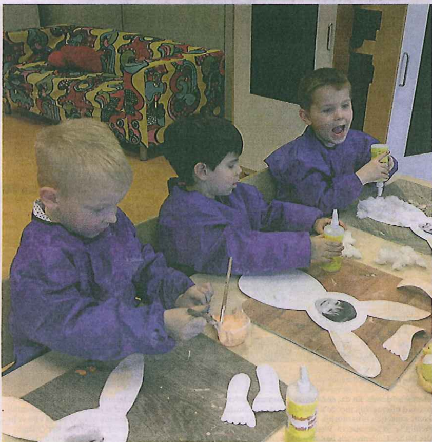
Concentratie tijdens het knutselen.

hebben we gekookt aan de hand van foto's. En in het kader van sport en spel hebben we bestaande spelletjes aangepast op het thema.” Ook was er een workshop journalistiek, waarbij de kinderen een eigen krantenpagina maakten. Normaal gesproken krijgen de kinderen de werkjes naar huis. Maar nu wordt een selectie als ware kunstwerken tentoon gesteld. Vandaag tussen 15 en 17 uur en 19 en 21 uur kunnen ouders, broers, zussen, opa's, oma's en belangstellenden de werkjes bewonderen in buurtcentrum de Schuilhoek.