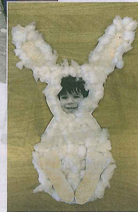
Een paashaas of toch een jongetje?

Vandaag de expositie bij buurtcentrum de Schuilhoek