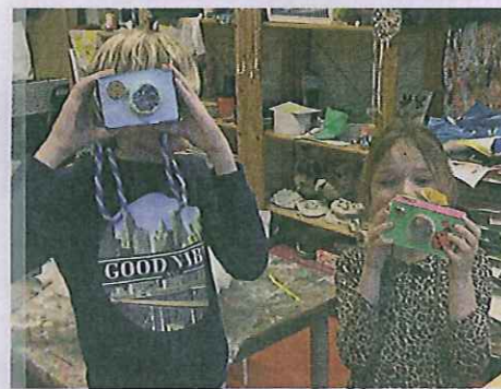
Een foto van jonge fotografen.